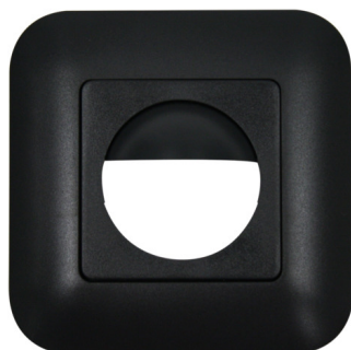
anthrazit matt, ähnlich RAL7021, Art.-Nr.: 92634