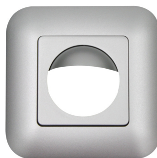
Edelstahl-Optik matt, ähnlich RAL9006, Art.-Nr.: 92633