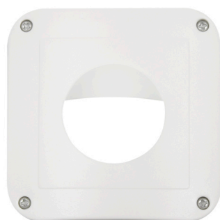
reinweiß matt, ähnlich RAL9010, Art.-Nr.: 92139