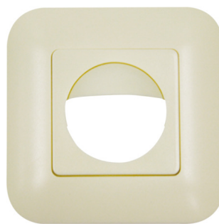
perlweiß matt, ähnlich RAL1013, Art.-Nr.: 92632