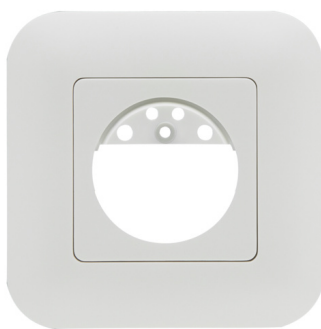
verkehrsweiß matt, ähnlich RAL9016, Art.-Nr.: 92631