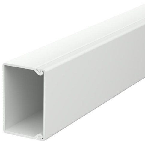
Kanaloberteil und -unterteil mit Bodenlochung.