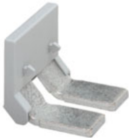
Einlegebrücke, Rastermaß: 31 mm, Polzahl: 2, Farbe: grau

Bitte beachten Sie, dass die hier angegebenen Daten dem Online-Katalog entnommen sind. Die vollständigen Informationen und Daten entnehmen Sie bitte der Anwenderdokumentation. Es gelten die Allgemeinen Nutzungsbedingungen für Internet-Downloads. ( http://phoenixcontact.de/download )