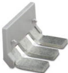
Einlegebrücke, Rastermaß: 31 mm, Polzahl: 3, Farbe: grau

Bitte beachten Sie, dass die hier angegebenen Daten dem Online-Katalog entnommen sind. Die vollständigen Informationen und Daten entnehmen Sie bitte der Anwenderdokumentation. Es gelten die Allgemeinen Nutzungsbedingungen für Internet-Downloads. ( http://phoenixcontact.de/download )