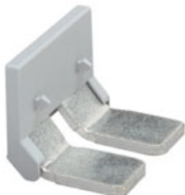
Einlegebrücke, Rastermaß: 36 mm, Polzahl: 2, Farbe: grau

Bitte beachten Sie, dass die hier angegebenen Daten dem Online-Katalog entnommen sind. Die vollständigen Informationen und Daten entnehmen Sie bitte der Anwenderdokumentation. Es gelten die Allgemeinen Nutzungsbedingungen für Internet-Downloads. ( http://phoenixcontact.de/download )