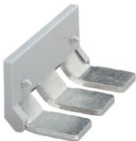
Einlegebrücke, Rastermaß: 36 mm, Polzahl: 3, Farbe: grau

Bitte beachten Sie, dass die hier angegebenen Daten dem Online-Katalog entnommen sind. Die vollständigen Informationen und Daten entnehmen Sie bitte der Anwenderdokumentation. Es gelten die Allgemeinen Nutzungsbedingungen für Internet-Downloads. ( http://phoenixcontact.de/download )