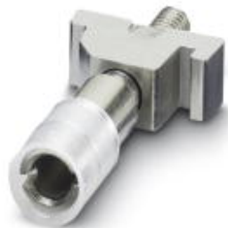
Prüfsteckerbuchse, mit Gleitsteg, Farbe: farblos

Bitte beachten Sie, dass die hier angegebenen Daten dem Online-Katalog entnommen sind. Die vollständigen Informationen und Daten entnehmen Sie bitte der Anwenderdokumentation. Es gelten die Allgemeinen Nutzungsbedingungen für Internet-Downloads. ( http://phoenixcontact.de/download )