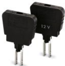
Sicherungsstecker, Nennstrom: 6,3 A, Länge: 33,1 mm, Breite: 6,1 mm, Höhe: 45,7 mm, Farbe: schwarz

Bitte beachten Sie, dass die hier angegebenen Daten dem Online-Katalog entnommen sind. Die vollständigen Informationen und Daten entnehmen Sie bitte der Anwenderdokumentation. Es gelten die Allgemeinen Nutzungsbedingungen für Internet-Downloads. ( http://phoenixcontact.de/download )