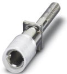
Prüfsteckerbuchse, Farbe: blau

Bitte beachten Sie, dass die hier angegebenen Daten dem Online-Katalog entnommen sind. Die vollständigen Informationen und Daten entnehmen Sie bitte der Anwenderdokumentation. Es gelten die Allgemeinen Nutzungsbedingungen für Internet-Downloads. ( http://phoenixcontact.de/download )