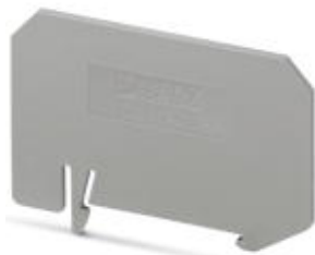
Abteilungstrennplatte, Länge: 64,4 mm, Breite: 2 mm, Höhe: 46 mm, Farbe: grau

Bitte beachten Sie, dass die hier angegebenen Daten dem Online-Katalog entnommen sind. Die vollständigen Informationen und Daten entnehmen Sie bitte der Anwenderdokumentation. Es gelten die Allgemeinen Nutzungsbedingungen für Internet-Downloads. ( http://phoenixcontact.de/download )