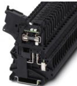
Hebelsicherungsklemme, Farbe schwarz, für 5 x 20 mm G-Sicherungseinsätze, mit Leuchtanzeige für 250 V AC

Bitte beachten Sie, dass die hier angegebenen Daten dem Online-Katalog entnommen sind. Die vollständigen Informationen und Daten entnehmen Sie bitte der Anwenderdokumentation. Es gelten die Allgemeinen Nutzungsbedingungen für Internet-Downloads. ( http://phoenixcontact.de/download )