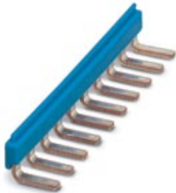
Einlegebrücke, Rastermaß: 6,15 mm, Polzahl: 10, Farbe: blau

Bitte beachten Sie, dass die hier angegebenen Daten dem Online-Katalog entnommen sind. Die vollständigen Informationen und Daten entnehmen Sie bitte der Anwenderdokumentation. Es gelten die Allgemeinen Nutzungsbedingungen für Internet-Downloads. ( http://phoenixcontact.de/download )