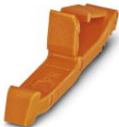
Verrastung, Länge: 29,8 mm, Breite: 10 mm, Polzahl: 1, Farbe: orange

Bitte beachten Sie, dass die hier angegebenen Daten dem Online-Katalog entnommen sind. Die vollständigen Informationen und Daten entnehmen Sie bitte der Anwenderdokumentation. Es gelten die Allgemeinen Nutzungsbedingungen für Internet-Downloads. ( http://phoenixcontact.de/download )