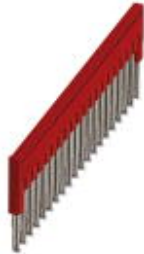
Steckbrücke, Rastermaß: 4,2 mm, Polzahl: 20, Farbe: rot

Bitte beachten Sie, dass die hier angegebenen Daten dem Online-Katalog entnommen sind. Die vollständigen Informationen und Daten entnehmen Sie bitte der Anwenderdokumentation. Es gelten die Allgemeinen Nutzungsbedingungen für Internet-Downloads. ( http://phoenixcontact.de/download )