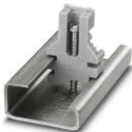
Endhalter, Breite: 8,5 mm, Farbe: grau

Bitte beachten Sie, dass die hier angegebenen Daten dem Online-Katalog entnommen sind. Die vollständigen Informationen und Daten entnehmen Sie bitte der Anwenderdokumentation. Es gelten die Allgemeinen Nutzungsbedingungen für Internet-Downloads. ( http://phoenixcontact.de/download )