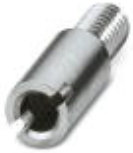
Prüfsteckerbuchse, Farbe: silberfarben

Prüfsteckerbuchse - PSB 3/10/4 - 0601292