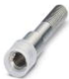
Prüfsteckerbuchse, Farbe: silberfarben

Prüfsteckerbuchse - PSBJ 3/13/4 - 0201304