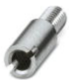
Prüfsteckerbuchse, Farbe: silberfarben

Prüfsteckerbuchse - PSB 3/10/4 - 0601292