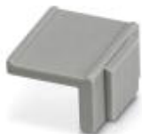
Geräte-Kennzeichnungsschild, Breite 12 mm