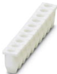
Isolierhülse, Farbe: weiß

Bitte beachten Sie, dass die hier angegebenen Daten dem Online-Katalog entnommen sind. Die vollständigen Informationen und Daten entnehmen Sie bitte der Anwenderdokumentation. Es gelten die Allgemeinen Nutzungsbedingungen für Internet-Downloads. ( http://phoenixcontact.de/download )