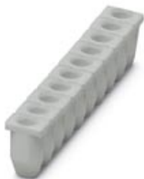
Isolierhülse, Farbe: grau

Bitte beachten Sie, dass die hier angegebenen Daten dem Online-Katalog entnommen sind. Die vollständigen Informationen und Daten entnehmen Sie bitte der Anwenderdokumentation. Es gelten die Allgemeinen Nutzungsbedingungen für Internet-Downloads. ( http://phoenixcontact.de/download )