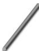
Verbindungsstift, Länge: 1000 mm, Farbe: grau