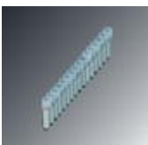
Feste Brücke, Polzahl: 16, Farbe: silberfarben