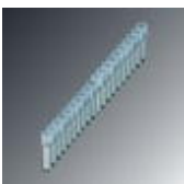
Feste Brücke, Rastermaß: 5 mm, Polzahl: 20, Farbe: silberfarben