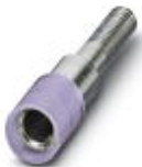
Prüfsteckerbuchse, Farbe: violett

Prüfsteckerbuchse - PSBJ 4/15/6 VT - 0303383