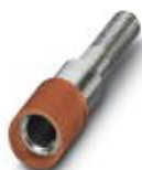
Prüfsteckerbuchse, Farbe: rot

Prüfsteckerbuchse - PSBJ 4/15/6 RD - 0303325