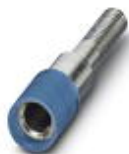
Prüfsteckerbuchse, Farbe: blau

Prüfsteckerbuchse - PSBJ 4/15/6 BU - 0303354