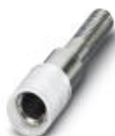
Prüfsteckerbuchse, Farbe: farblos

Prüfsteckerbuchse - PSBJ 4/15/6 FARBLOS - 0303419