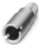
Prüfsteckerbuchse, Farbe: silberfarben