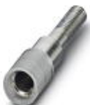
Prüfsteckerbuchse, Farbe: grau

Prüfsteckerbuchse - PSBJ 4/15/6 GY - 0303396