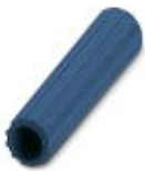
Isolierhülse, Farbe: blau