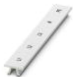
Marker für Klemmen, Streifen, weiß, beschriftet, längs bedruckt: L1, L2, L3, N, PE, Montageart: verrasten in hoher Schildchennut, für Klemmenbreite: 15,2 mm, Schriftfeldgröße: 10,5 x 15,1 mm

Marker für Klemmen - ZB 15,LGS:L1-N,PE - 0811998