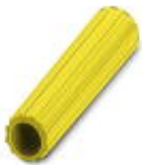
Isolierhülse, Farbe: gelb