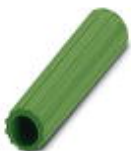
Isolierhülse, Farbe: grün