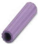
Isolierhülse, Farbe: violett