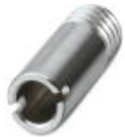
Prüfsteckerbuchse, Farbe: silberfarben