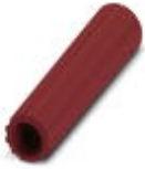
Isolierhülse, Farbe: rot