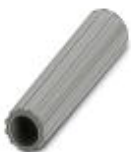
Isolierhülse, Farbe: grau