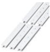
Zackband, bestellbar: streifenweise, weiß, beschriftet nach Kundenangaben, Montageart: verrasten in hoher Schildchennut, für Klemmenbreite: 15,2 mm, Schriftfeldgröße: 10,5 x 15,1 mm

Marker für Klemmen - ZB 15,LGS:L1-N,PE - 0811998