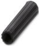
Isolierhülse, Farbe: schwarz