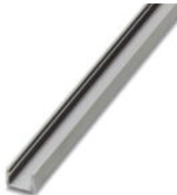
Profil, selbstklebend, zur Aufnahme von SS-ZB-Schildern, UC-EMP, US-EMP, Länge: 1 m

Bitte beachten Sie, dass die hier angegebenen Daten dem Online-Katalog entnommen sind. Die vollständigen Informationen und Daten entnehmen Sie bitte der Anwenderdokumentation. Es gelten die Allgemeinen Nutzungsbedingungen für Internet-Downloads. ( http://phoenixcontact.de/download )