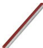
Endlossteckbrücke, Länge: 500 mm, Farbe: rot

Endlossteckbrücke - FBST 500-PLC RD - 2966786