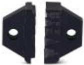
Ersatz-Gesenk für CRIMPFOX 6