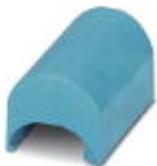
Ersatzabfallschale für CF-CRIMPHANDY

Abdeckung - CF CRIMPHANDY/COVER - 1212709