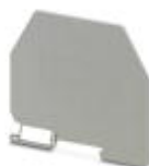
Abteilungstrennplatte, Länge: 99 mm, Breite: 2 mm, Höhe: 90 mm, Farbe: grau