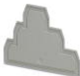
Abschlussdeckel, Länge: 90 mm, Breite: 2,2 mm, Höhe: 69,8 mm, Farbe: grau