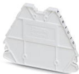
Abschlussdeckel, Länge: 63,6 mm, Breite: 2,2 mm, Höhe: 48,9 mm, Farbe: weiß

Bitte beachten Sie, dass die hier angegebenen Daten dem Online-Katalog entnommen sind. Die vollständigen Informationen und Daten entnehmen Sie bitte der Anwenderdokumentation. Es gelten die Allgemeinen Nutzungsbedingungen für Internet-Downloads. ( http://phoenixcontact.de/download )