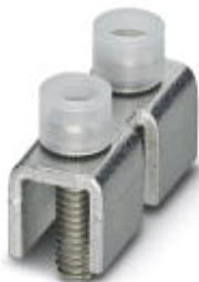
Feste Brücke, Polzahl: 2, Farbe: silberfarben

Bitte beachten Sie, dass die hier angegebenen Daten dem Online-Katalog entnommen sind. Die vollständigen Informationen und Daten entnehmen Sie bitte der Anwenderdokumentation. Es gelten die Allgemeinen Nutzungsbedingungen für Internet-Downloads. ( http://phoenixcontact.de/download )