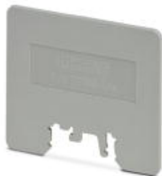
Abteilungstrennplatte, Länge: 80 mm, Breite: 2 mm, Höhe: 70 mm, Farbe: grau

Bitte beachten Sie, dass die hier angegebenen Daten dem Online-Katalog entnommen sind. Die vollständigen Informationen und Daten entnehmen Sie bitte der Anwenderdokumentation. Es gelten die Allgemeinen Nutzungsbedingungen für Internet-Downloads. ( http://phoenixcontact.de/download )