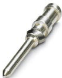
Gedrehter 1,6er Crimpkontakt, Stift-Einzelkontakt, Aderquerschnitt 2,5 mm², versilbert

Bitte beachten Sie, dass die hier angegebenen Daten dem Online-Katalog entnommen sind. Die vollständigen Informationen und Daten entnehmen Sie bitte der Anwenderdokumentation. Es gelten die Allgemeinen Nutzungsbedingungen für Internet-Downloads. ( http://phoenixcontact.de/download )