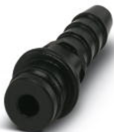
Pneumatik-Stift, für HC-M-PN3-Modul, Schlauchinnendurchmesser 4,0 mm

Bitte beachten Sie, dass die hier angegebenen Daten dem Online-Katalog entnommen sind. Die vollständigen Informationen und Daten entnehmen Sie bitte der Anwenderdokumentation. Es gelten die Allgemeinen Nutzungsbedingungen für Internet-Downloads. ( http://phoenixcontact.de/download )