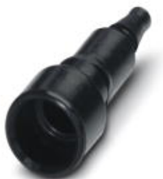
Pneumatik-Buchse, für HC-M-PN3-Modul, Schlauchinnendurchmesser 3,0 mm

Bitte beachten Sie, dass die hier angegebenen Daten dem Online-Katalog entnommen sind. Die vollständigen Informationen und Daten entnehmen Sie bitte der Anwenderdokumentation. Es gelten die Allgemeinen Nutzungsbedingungen für Internet-Downloads. ( http://phoenixcontact.de/download )