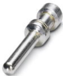
Gedrehter 2,5er Crimpkontakt, Stift-Einzelkontakt, Aderquerschnitt 4,00 mm 2 , versilbert

Bitte beachten Sie, dass die hier angegebenen Daten dem Online-Katalog entnommen sind. Die vollständigen Informationen und Daten entnehmen Sie bitte der Anwenderdokumentation. Es gelten die Allgemeinen Nutzungsbedingungen für Internet-Downloads. ( http://phoenixcontact.de/download )