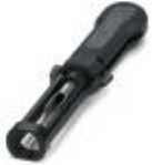
Entriegelungswerkzeug, für gedrehte CK- 2,5-...Kontakte

Entriegelungswerkzeug - CK2,5-EWZ - 1662722