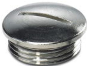
Verschlusschraube, Material Verschraubung: Messing, vernickelt, Messing, vernickelt, Anschlussgewinde: Pg13,5, Farbe: silberfarben

Bitte beachten Sie, dass die hier angegebenen Daten dem Online-Katalog entnommen sind. Die vollständigen Informationen und Daten entnehmen Sie bitte der Anwenderdokumentation. Es gelten die Allgemeinen Nutzungsbedingungen für Internet-Downloads. ( http://phoenixcontact.de/download )