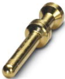
Gedrehter 2,5er Crimpkontakt, Stift-Einzelkontakt, Aderquerschnitt 1,5 mm 2 , vergoldet

Bitte beachten Sie, dass die hier angegebenen Daten dem Online-Katalog entnommen sind. Die vollständigen Informationen und Daten entnehmen Sie bitte der Anwenderdokumentation. Es gelten die Allgemeinen Nutzungsbedingungen für Internet-Downloads. ( http://phoenixcontact.de/download )