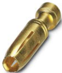
Gedrehter 2,5er Crimpkontakt, Buchsen-Einzelkontakt, Aderquerschnitt 1,5 mm 2 , vergoldet

Bitte beachten Sie, dass die hier angegebenen Daten dem Online-Katalog entnommen sind. Die vollständigen Informationen und Daten entnehmen Sie bitte der Anwenderdokumentation. Es gelten die Allgemeinen Nutzungsbedingungen für Internet-Downloads. ( http://phoenixcontact.de/download )