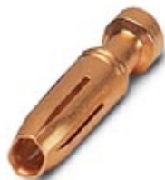
Gedrehter 2,5er Crimpkontakt, Buchsen-Einzelkontakt, Aderquerschnitt 4,00 mm 2 , vergoldet

Bitte beachten Sie, dass die hier angegebenen Daten dem Online-Katalog entnommen sind. Die vollständigen Informationen und Daten entnehmen Sie bitte der Anwenderdokumentation. Es gelten die Allgemeinen Nutzungsbedingungen für Internet-Downloads. ( http://phoenixcontact.de/download )