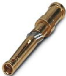
Gedrehter 1,6er Crimpkontakt, Buchsen-Einzelkontakt, Aderquerschnitt 1,5 mm 2 , vergoldet

Bitte beachten Sie, dass die hier angegebenen Daten dem Online-Katalog entnommen sind. Die vollständigen Informationen und Daten entnehmen Sie bitte der Anwenderdokumentation. Es gelten die Allgemeinen Nutzungsbedingungen für Internet-Downloads. ( http://phoenixcontact.de/download )