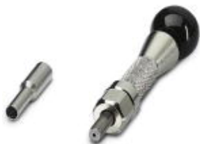
Entriegelungswerkzeug, für Koaxialkontakte

Bitte beachten Sie, dass die hier angegebenen Daten dem Online-Katalog entnommen sind. Die vollständigen Informationen und Daten entnehmen Sie bitte der Anwenderdokumentation. Es gelten die Allgemeinen Nutzungsbedingungen für Internet-Downloads. ( http://phoenixcontact.de/download )