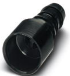
Pneumatik-Buchse, für HC-M-PN2-Modul, Schlauchinnendurchmesser 6,0 mm

Bitte beachten Sie, dass die hier angegebenen Daten dem Online-Katalog entnommen sind. Die vollständigen Informationen und Daten entnehmen Sie bitte der Anwenderdokumentation. Es gelten die Allgemeinen Nutzungsbedingungen für Internet-Downloads. ( http://phoenixcontact.de/download )