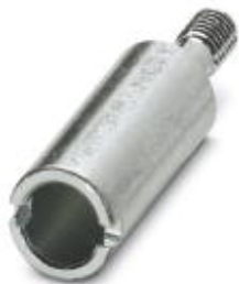
Kodierbuchse zur Kodierung von bis zu 16 Steckverbindern

Bitte beachten Sie, dass die hier angegebenen Daten dem Online-Katalog entnommen sind. Die vollständigen Informationen und Daten entnehmen Sie bitte der Anwenderdokumentation. Es gelten die Allgemeinen Nutzungsbedingungen für Internet-Downloads. ( http://phoenixcontact.de/download )