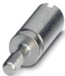
Kodierbuchse zur Kodierung von bis zu 16 Steckverbindern, für HC-Modular

Bitte beachten Sie, dass die hier angegebenen Daten dem Online-Katalog entnommen sind. Die vollständigen Informationen und Daten entnehmen Sie bitte der Anwenderdokumentation. Es gelten die Allgemeinen Nutzungsbedingungen für Internet-Downloads. ( http://phoenixcontact.de/download )