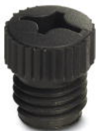
M8-Verschlusschraube für nicht belegte M8-Buchsen der Sensor-/Aktor-Kabel, Boxen und Einbausteckverbinder

Bitte beachten Sie, dass die hier angegebenen Daten dem Online-Katalog entnommen sind. Die vollständigen Informationen und Daten entnehmen Sie bitte der Anwenderdokumentation. Es gelten die Allgemeinen Nutzungsbedingungen für Internet-Downloads. ( http://phoenixcontact.de/download )