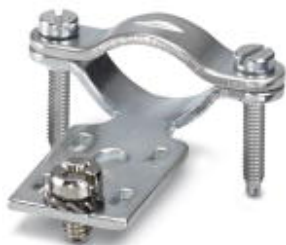
Zugentlastungsschellen, für Kontakteinsätze der Serien: B-, BB-, D 40, D 64, DD und HV, gerader Kabelabgang

Bitte beachten Sie, dass die hier angegebenen Daten dem Online-Katalog entnommen sind. Die vollständigen Informationen und Daten entnehmen Sie bitte der Anwenderdokumentation. Es gelten die Allgemeinen Nutzungsbedingungen für Internet-Downloads. (http://phoenixcontact.de/download)