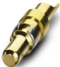
Power-Kontakte, für D-SUB-Kombinationseinsätze, Stift, Lötkelch, gerade, Bemessungsstrom 20 A, vergoldet

Bitte beachten Sie, dass die hier angegebenen Daten dem Online-Katalog entnommen sind. Die vollständigen Informationen und Daten entnehmen Sie bitte der Anwenderdokumentation. Es gelten die Allgemeinen Nutzungsbedingungen für Internet-Downloads. ( http://phoenixcontact.de/download )