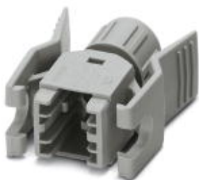
RJ45-Tüllengehäuse, IP20, für Stifteinsatz VS-08-ST-RJ45, mit Push-Pull-Verriegelung zum Anbaurahmen, für Kabeldurchmesser 5,0 mm ... 6,5 mm

Bitte beachten Sie, dass die hier angegebenen Daten dem Online-Katalog entnommen sind. Die vollständigen Informationen und Daten entnehmen Sie bitte der Anwenderdokumentation. Es gelten die Allgemeinen Nutzungsbedingungen für Internet-Downloads. ( http://phoenixcontact.de/download )